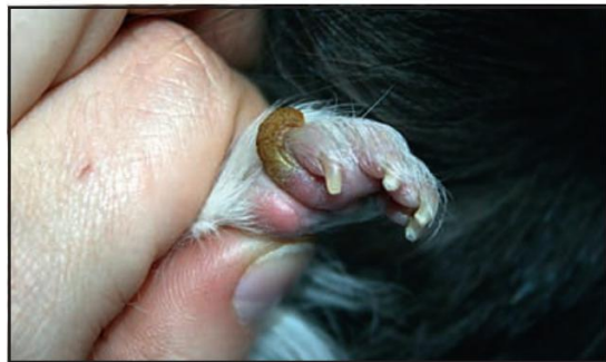
Tass med förhårdnad

Marsvinstassar ska vara mjuka och smidiga. De allra flesta marsvin får dock i vuxen ålder hudförhårdnader på tassarna. Om de lämnas kan de växa ut och nästan se ut som sporrar. Då det är just hudförhårdnader så har förstås ingen känsel i dem och man kan klippa bort dem med en vanlig nagelklippare innan de vuxit sig för långa och stora. Risken är annars att marsvinet råkar slita av dem själva vilket kan orsaka mycket smärta. Om man vill kan man fila den sista biten av förhårdnaden med en vanlig nagelfil för att få tassan mjuk och smörja med en fet salva efteråt